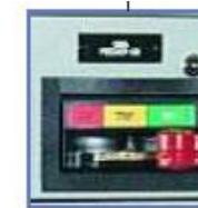
Arrancador FNVR tamaño 1