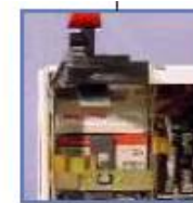
Agarraderas para levantar