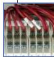
Bloques terminales de control separadas