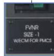
Grandes placas personalizadas