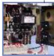
Arrancadores 1 y 2 intercambiables